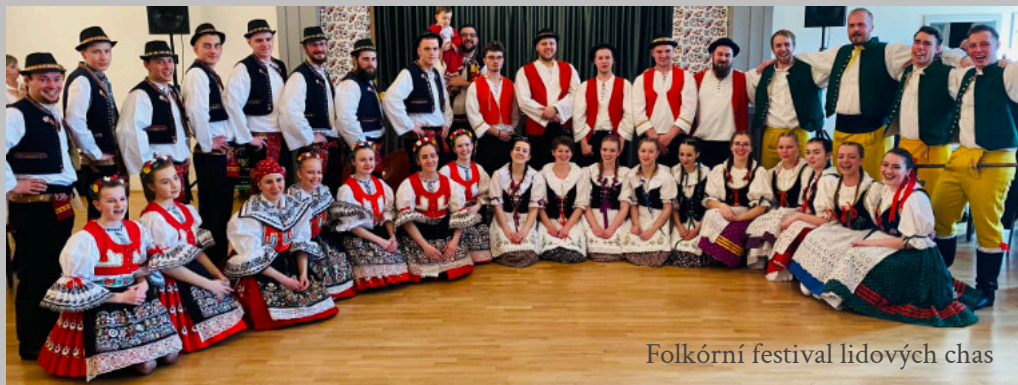
Folkórní festival lidových chas

Obec rovněž podala žádosti o finanční podporu z rozpočtu Jihomoravského kraje na vybavení šaten v kabinách na fotbalovém hřišti, na vybavení knihovny a SDH podal žádost o dotaci na výměnu oken, dveří a výmalbu budovy na Bahňáku. Bohužel ani tyto žádosti nebyly podpořeny. Jedinou žádostí, kterou Jihomoravský kraj podpořil, byla žádost na vybavení JSDH. Přesto jsme se pustili do vybavení knihovny v novém KC, na jejíž